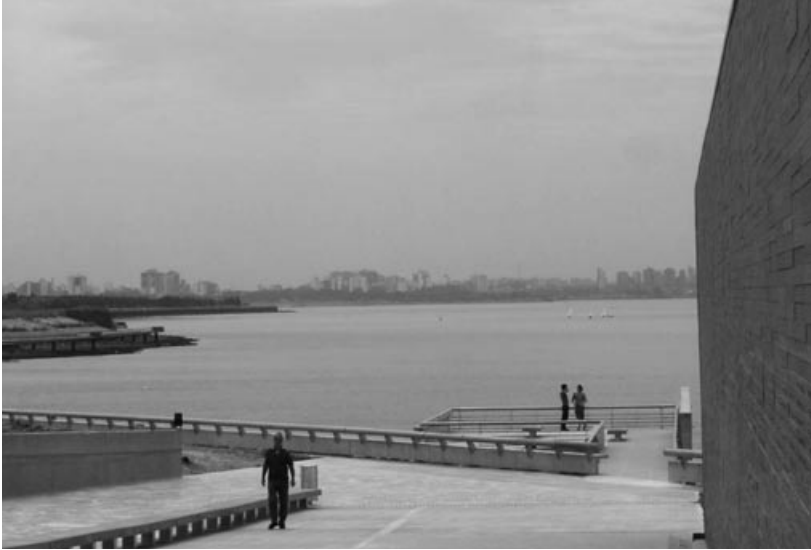
Ansicht des Denkmals mit den Namen der „Verschwundenen“ im „Park der Erinnerung“, am Ufer des Río de la Plata