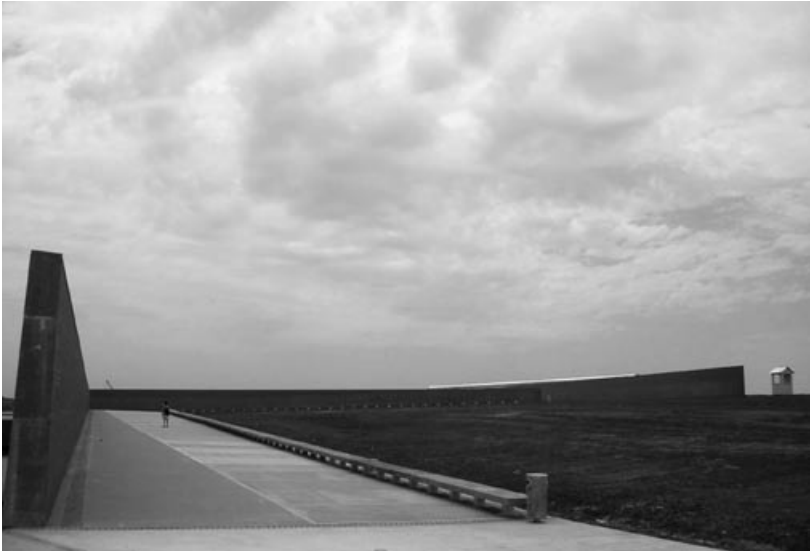
Ansicht des Denkmals mit den Namen der „Verschwundenen“ im „Park der Erinnerung“ in Buenos Aires