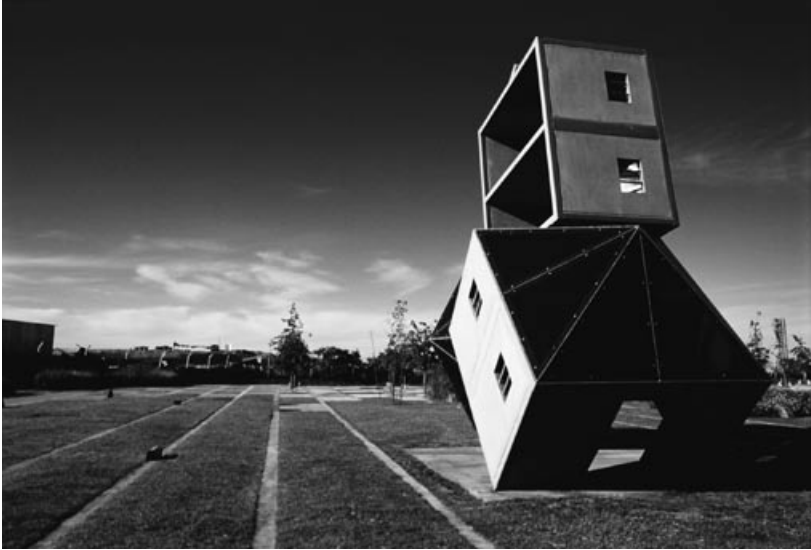
Ansicht des „Parks der Erinnerung“ in Buenos Aires mit der Skulptur Monumento al escape (Denkmal für die Flucht) von Dennis Oppenheim