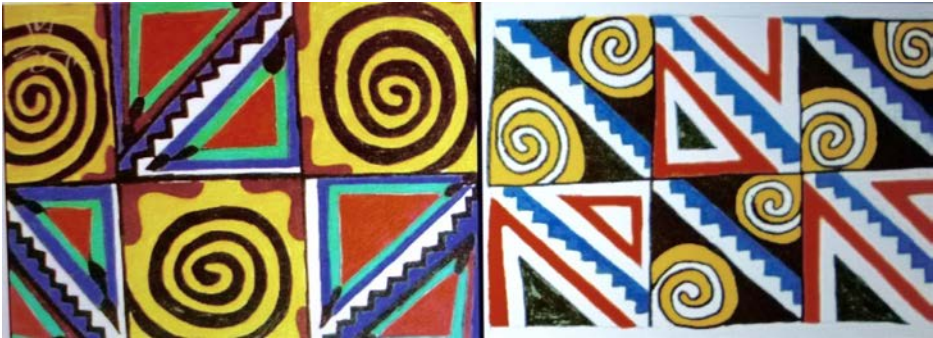
Figura 14. Motivos da pintura corporal Kadiwéu (reproduzido de Vidal 1992).