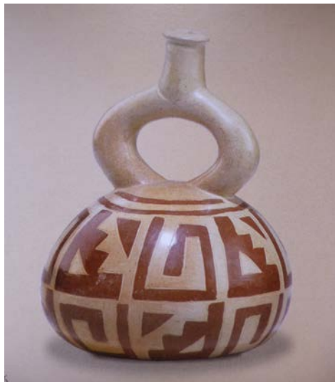
Figura 5. Vaso cerâmico de alça estribo com motivos escalonados no bojo. Mochica (Museo Larco, Peru. Reproduzido de Arcuri 2005).