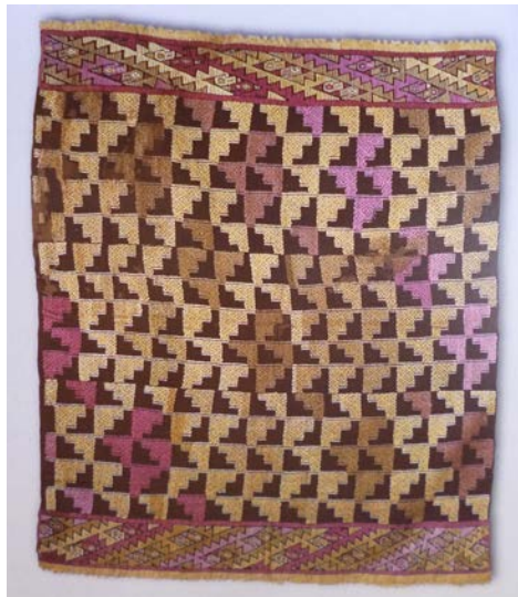
Figura 10. Tecido com motivos escalonados em espelho. Chancay (Coleção MASP Landmann, Brasil. Reproduzido de Arcuri 2005).