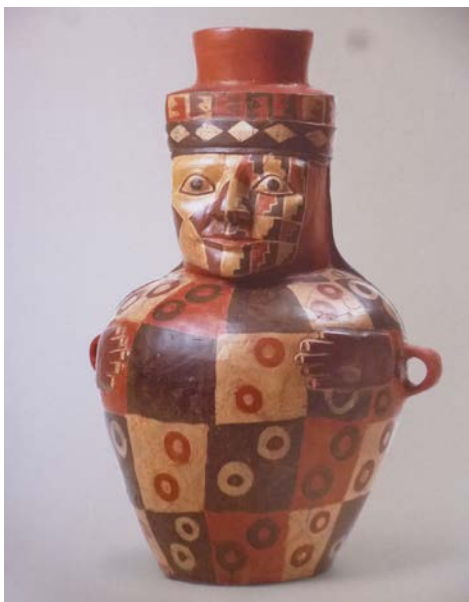
Figura 8. Vaso cerâmico de gargalo antropomorfo com motivos escalonados na face. Huari (Museo Nacional de Arqueología, Antropología e Historia del Perú. Reproduzido de Arcuri 2005).

O esquema quadripartido sintetizado na chakana ou cruz andina é recorrente na cultura material arqueológica e etnográfica andina, há cerca de cinco mil anos. Tornou-se, hoje, marca de identidade cultural do mundo andino. Em artigo publicado em 2009, apresentamos uma análise iconográfica da cena de sacrifício na montanha, dedicado a Ai apaec (entidade criadora/decaptadora moche), correlacionando-as com as 'volutas escalonadas' e o princípio do dualismo dinâmico formador do escalonamento quadripartido, presentes na iconografia Moche e Lamabayeque (Figuras 2 a 6). Àquelas evidências, podemos acrescentar exemplares do Formativo, bem como Huari, Chancay, Chimú e Inca (Figuras 7 a 12). Ainda no referido artigo, defendemos que a concepção organizadora do território do Tahuantinsuyu Inca surgiu desse princípio, precedendo em muitos séculos os tempos incaicos, diferentemente do que defendem autores que atribuem a origem do conceito às fontes coloniais (Arcuri 2009, 50).