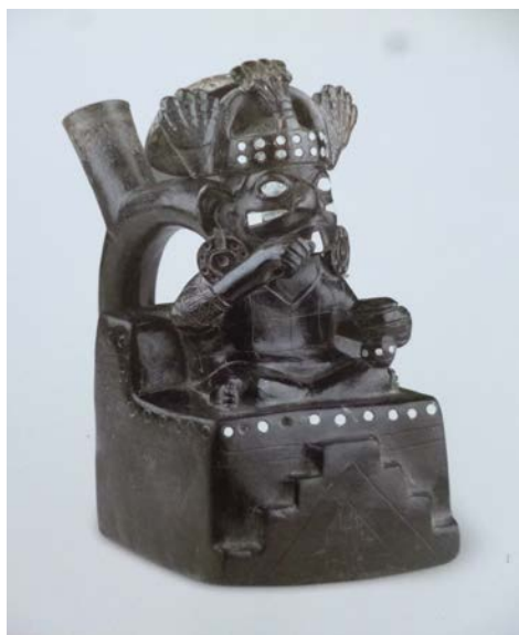
Figura 4. Vaso cerâmico de alça estribo com detalhe escalonado na face frontal do bojo. Mochica (Museo Larco, Peru. Reproduzido de Arcuri 2005).