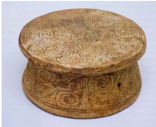
Figura 15. Banco cerâmico com motivos escalonados e volutas. Marajoara (Museu Nacional da Universidade Federal do Rio de Janeiro. Reproduzido de MacEwan, Barreto e Neves 2001).

poderiam ter sido eleitos para fundamentar a análise, focamos nas 'cosmografias rituais', por serem elas aqui entendidas como transformações que ativam e recriam dinâmicas e ciclos sociocósmicos. As especificidades metodológicas e teóricas referentes aos estudos arqueológicos de contextos remotos também foram abordadas, mas sempre em diálogo com o panorama oferecido pelas etnografias ameríndias. De forma inspirada nesse diálogo, permanece a sugestão de se aproximar as perspectivas da semiótica e da cinética, da estrutura e do movimento, na leitura da icnografia ameríndia. Transpondo para a comunicação visual, pode-se então dizer que a materialização que se dá nos rituais pode ser lida, de forma polissêmica e dinâmica, como as palavras dentro de seus contextos semânticos. Assim, na 'qualidade comunicativa da arte', as 'cosmo-grafias' e os objetos por ela gerados agem em diferentes níveis e tempos. Como defende Alberti, não são representações estáticas, mas extensões 'móveis da prática'.