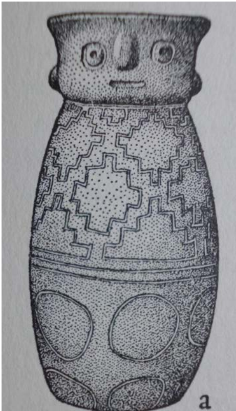
Figura 13. Urna com motivos chakana na parte superior do bojo. Cañari (reproduzido de Meggers 1966).

tempo, espaço, fronteiras, planos, mundos e entes que interagem a partir de princípios de reprodução e reciprocidade. Observamos a recorrência, nas evidências analisadas, de princípios organizadores que parecem seguir dinâmicas e paradigmas estruturados na continuidade, na permanência de práticas rituais atentas à necessidade promover a interação entre diferentes sujeitos/planos/esferas/âmbitos (relações essas primordialmente marcadas pelas oposições e multiplicações reprodutivas). Dentre outros exemplos que