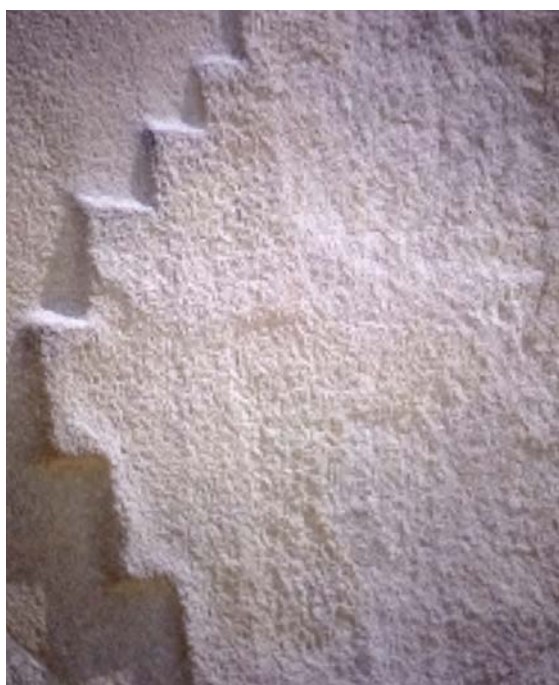
Figura 12. Motivo chakana em fachada arquitetônica de Ollantaytambo.