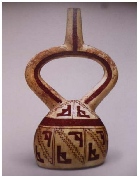
Figura 6. Vaso cerâmico de alça estribo com motivos escalonados em espelho/quadripartição. Mochica (Museu de Arqueologia e Etnologia da USP, Brasil. Reproduzido de Arcuri 2005).