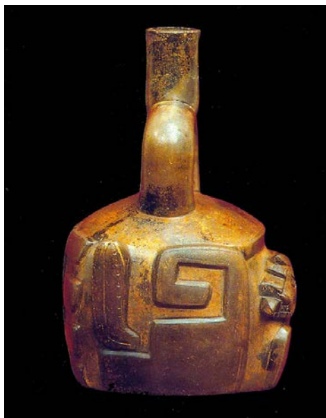
Figura 7. Vaso cerâmico de alça estribo com motivo ‘voluta escalonada’. Formativo Andino (Coleção Particular.).

inundações, secas, 7 etc. Tais evidências encontram eco nos referenciais etnográficos das cosmologias andinas. Há muito tempo o modelo do arquipélago vertical proposto por Rowe –que defende a influencia da variedade de altitudes e zonas ecológicas nos Andes no desenvolvimento de um modelo particular de cultivo, armazenamento, comércio e distribuição, entre diferentes comunidades– é tido como base formadora não apenas de uma economia pautada na adaptabilidade (viés de análise do próprio Rowe), mas das ontologias e conhecimentos comuns dos povos da cordilheira.