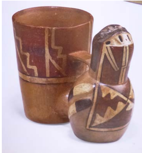
Figura 9. Vaso cerâmico com motivos escalonados pintados no bojo posterior. Huari (Museo Larco, Peru. Reproduzido de Arcuri 2005).