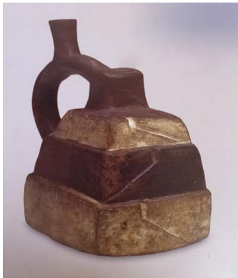
Figura 3. Vaso cerâmico de alça estribo em formato de montanha ou pirâmide escalonada. Mochica (Museu de Arqueologia e Etnologia da USP, Brasil. Reproduzido de Arcuri 2005).