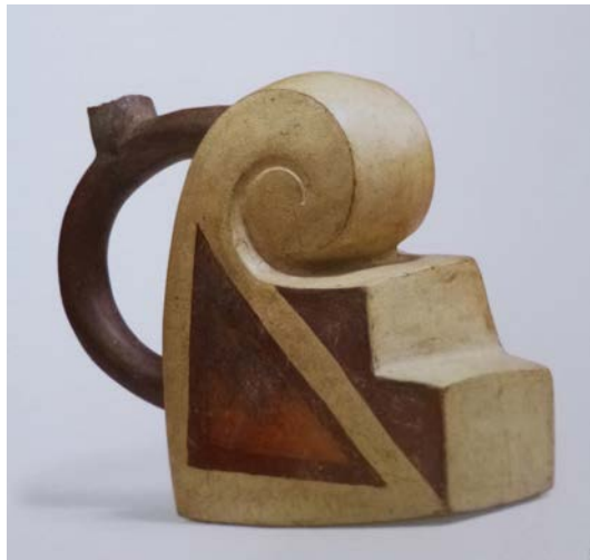
Figura 2. Vaso cerâmico de alça estribo em forma de 'voluta escalonada'. Mochica (Museo Larco, Peru. Reproduzido de Arcuri 2005).