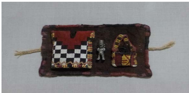
Figura 11. Artefato em tecido e metal com motivos escalonados. Inca (Museo Pachacamac, Peru. Foto: Marcia Arcuri).