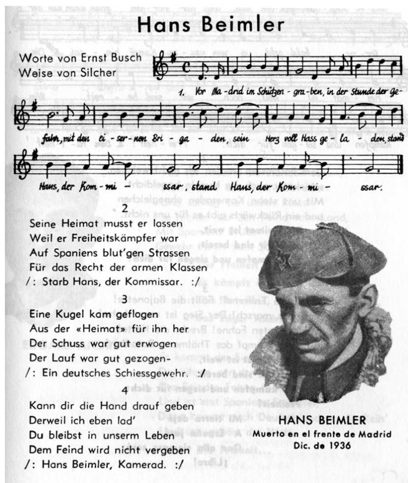
Abb. 2: Ernst Busch: "Hans Beimler-Lied" (1938)

Quelle: Ernst Busch (Hrsg.) (1938): "Hans Beimler-Lied". In: Canciones de las Brigadas Internacionales. Por encargo de las Brigadas Internacionales . Barcelona, S. 31.