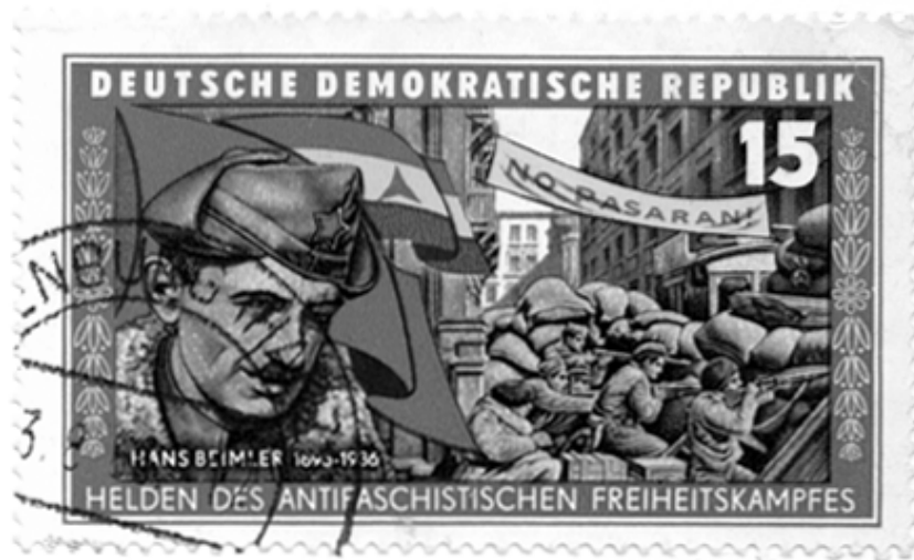
Abb. 4: Deutsche Demokratische Republik: “Helden des antifaschistischen Freiheitskampfes. Hans Beimler”. 15 Pfennig-Briefmarke (1966)

Militärübungen der NVA verknüpft und es kommen mehrere Spanienkriegsteilnehmer als Zeitzeugen zu Wort (Taeye o.J. [1983]).