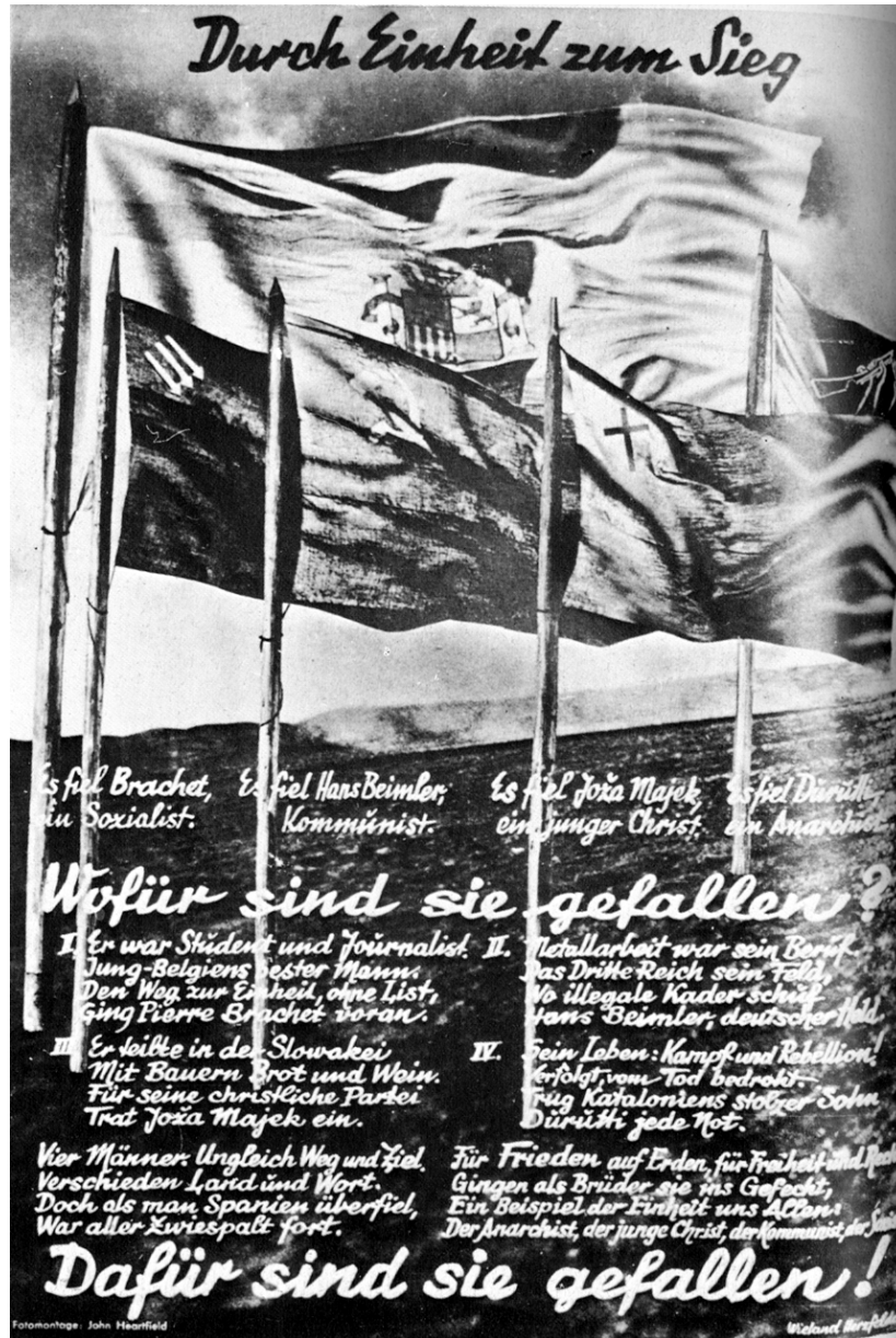
Abb. 3: John Heartfield: "Durch Einheit zum Sieg"